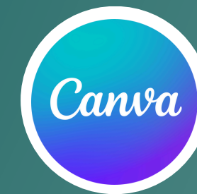
Canva Magic Write